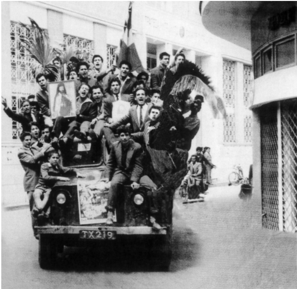
Ανακοινώνεται η απελευθέρωση του Μακαρίου από τις Σεϋχέλλες (1957), αλλά απαγορεύεται η είσοδός του στην Κύπρο. Ο λαός πανηγυρίζει στους δρόμους. Μέχρι όμως να επιστρέψει ο Μακάριος στην Κύπρο, χρειάστηκε ακόμα σκληρός αγώνας και θυσίες από τους αγωνιστές.