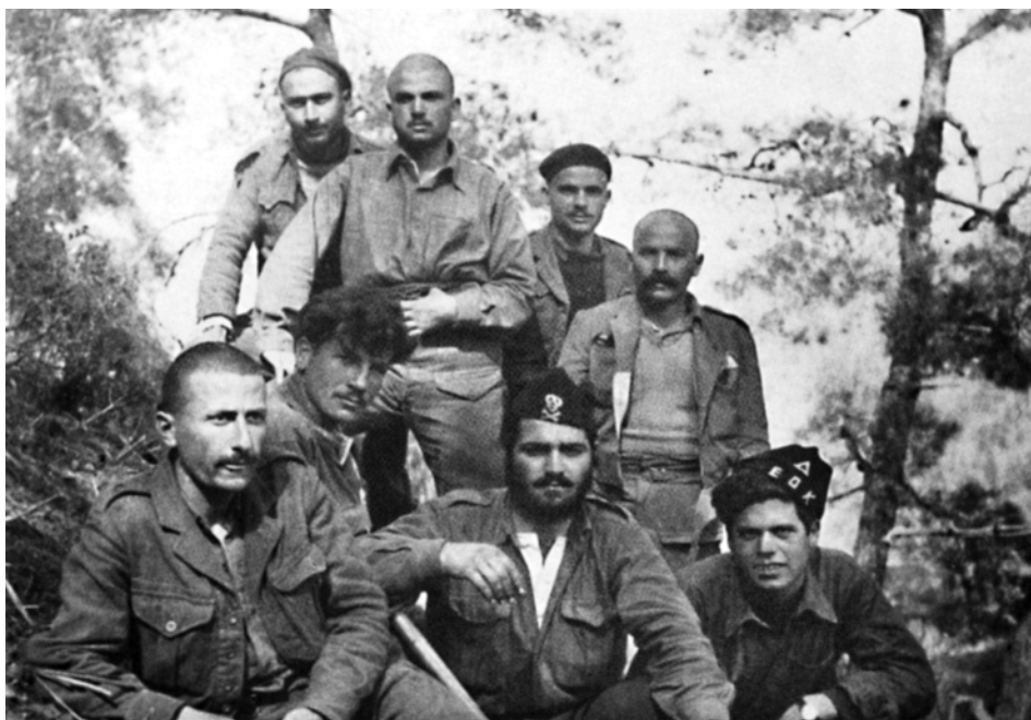
Η αντάρτικη ομάδα «Ουρανός» του θρυλικού Μάρκου Δράκου (καθισμένος, με ξυρισμένο κεφάλι).

Ο Γιωρκάτζης ήταν άνθρωπος με φοβερά οργανωτικό μυαλό, πείσμονας σε ό,τι αναλάμβανε να κάμει και με πολλή πίστη σ' αυτό που έκαμνε.