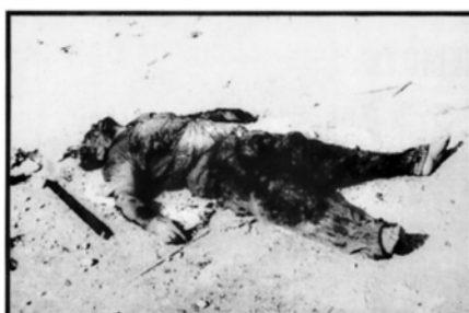
Οι τέσσερις πεσόντες στον αχυρώνα Λιοπετρίου.